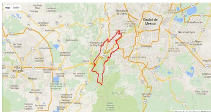
Imagen 1. Ubicación de la Alcaldía de Cuajimalpa de Morelos, CDMX.

La Alcaldía de Cuajimalpa de Morelos se localiza al suroeste de la Ciudad de México, a una altitud media de 2,750 metros sobre el nivel del mar. Sus coordenadas extremas son: al norte 19°24' y al sur 19°13', de latitud norte; al este 99°15' y al oeste 99°22' de longitud oeste. Limita al norte con el municipio de Huixquilucan, Estado de México y la Delegación Miguel Hidalgo; al oriente con las Delegaciones Miguel Hidalgo y Álvaro Obregón; al sur con la Delegación Álvaro Obregón y los municipios de Jalatlaco y Ocoyoacac del Estado de México; y al poniente con los municipios de Ocoyoacac, Lerma y Huixquilucan, pertenecientes al Estado de México (ver mapa No.1). La Alcaldía de Cuajimalpa de Morelos tiene una superficie territorial de 8,177.6 hectáreas. Lo que representa el 5.5% de la superficie de la Ciudad de México. El 80.0% de la superficie de esta demarcación es suelo de conservación y el resto corresponde a la zona urbana (Delegación Cuajimalpa, 2009).